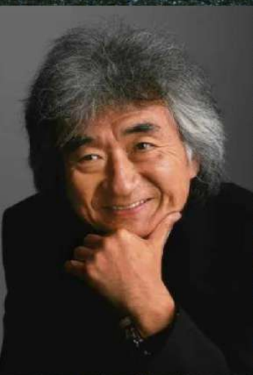
小澤征爾 音樂總監 世界各大名團指揮 當代最傳奇日本指揮家