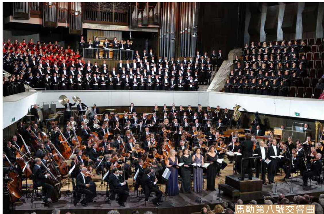
馬勒第八號交響曲

住宿 / NH Leipzig Zentrum 或 Capri by Fraser 或同等級