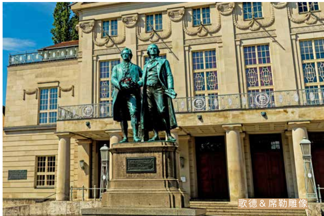
歌德 & 席勒雕像

住宿 / NH Leipzig Zentrum 或 Capri by Fraser 或同等級